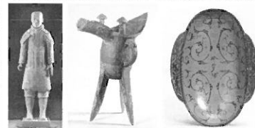
中国の国家一級文物21点を含む 約110点を公開!

東北歴史博物館 / 盛岡 / 仙台三越 / ローションチケット / チケットぴあ 他