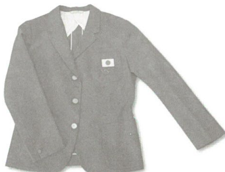
デレゲーションユニフォーム (小野喬) 第18回東京大会 / 1964年

日本初参加となるストックホルム大会で陸上競技の三島弥彦が実際に着用したものです。