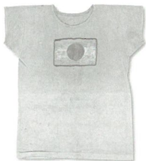
ユニフォーム (三島弥彦) 第5回ストックホルム大会 / 1912年

日本初参加となるストックホルム大会で陸上競技の三島弥彦が実際に着用したものです。