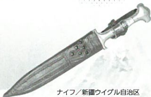
ナイフ/ 新疆ウイグル自治区

21世紀になると装備の進化などにより、ヒマラヤ登山は身近なものになります。登山は探検というよりも、スポーツや観光の一つになりました。