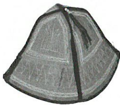
男性用帽子/ 新疆ウイグル自治区