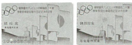
第12回国際オリンピック大会開催 東京市決定記念市営自動車乗車券 第12回東京大会 / 1940年

西田と大江は2位3位決定戦を日本人同士で争うことをやめ、帰国後に銀と銅を半分ずつ分け合った。このメダルはその大江が持っていたものである。大江は陸軍に招集され、第2次世界大戦で戦死した。