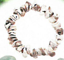
ヒスイ大珠と貝殻の垂飾品 岩手県大向上平遺跡 岩手県教育委員会蔵