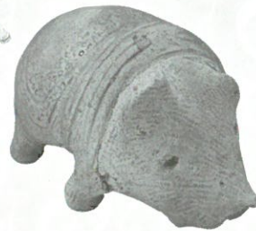
クマ形土製品 岩手県上杉遺跡 二戸市教育委員会 蔵

この展示は、ひとりでじっくり見たり、家族やお友達とふしぎに思ったことや発見したことを話したりしながら見ることができます。みんなが楽しく展示室で過ごせるように【やくそく】をまもってね。