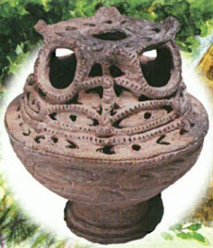
香炉形土器 宮城県里浜貝塚 館蔵