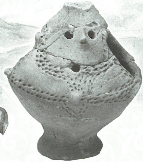
人面裝飾付香炉形土器 岩手県駒板3遺跡 軽米町教育委員会 蔵