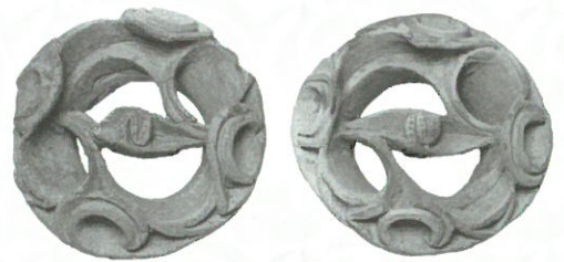
土製耳飾り 埼玉県赤城遺跡 埼玉県教育委員会 蔵