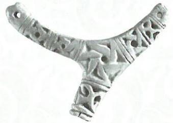
鹿の角でつくった腰飾り 宮城県里浜貝塚 館蔵