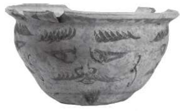
長岡京の災厄を祓う 長岡京東南境界祭祀遺跡出土品 人面墨書土器(京都市)