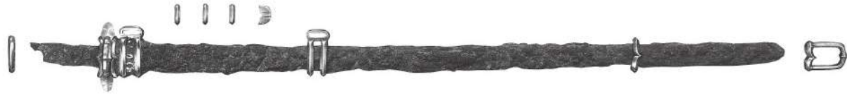
坂上田村麻呂 ゆかりの名品 国宝 山科西野山古墓出土品 金装大刀(京都大学総合博物館)