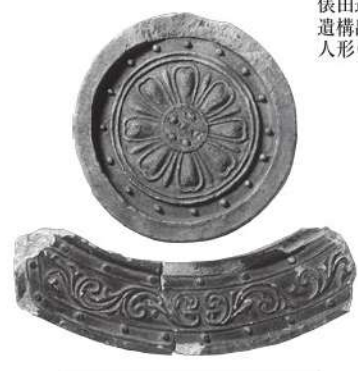
平安宮の屋根を美しく飾る瓦 重要文化財 平安宮豊楽殿跡出土品 緑釉軒瓦(京都市)