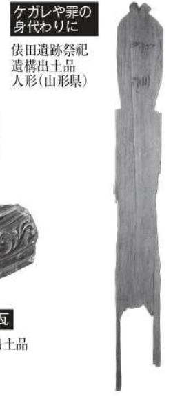
ケガレや罪の身代わりに 依田遺跡祭祀遺構出土品 人形(山形県)