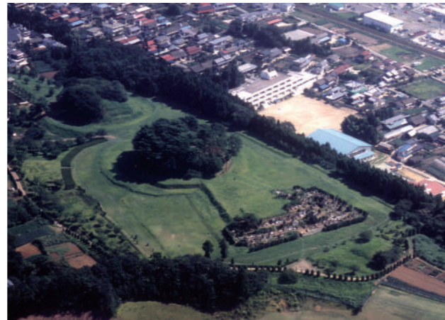
宮城県 雷神山古墳(手前)と小塚古墳(奥)