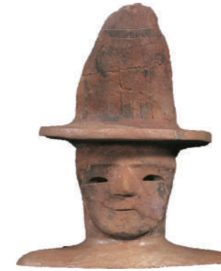
はにわ 埴輪 帽子を被る男 東北歴史博物館 蔵