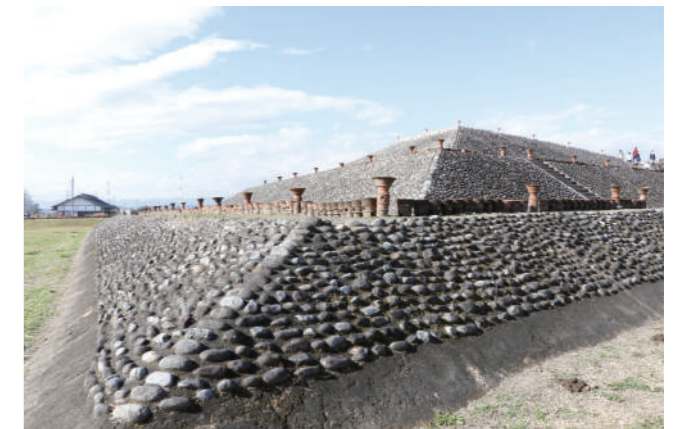
古墳に置かれたはにわ(群馬県保田八幡塚古墳)