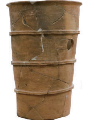
はにわ 埴輪 円筒埴輪 宮城県 毘沙門堂古墳 名取市教育委員会 蔵