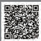
午前にご来場の方