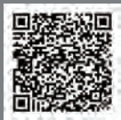
午後にご来場の方

イベント当日は、予約した時間帯の間に博物館へ お越しください。 館内で「参加証」を差し上げます。