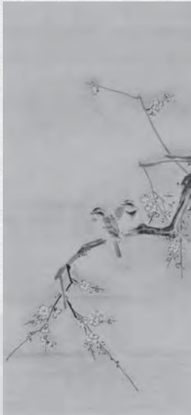
「梅に小禽図」 伊達政宗筆 個人蔵