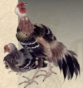
「花鳥」部分 佐々木原善筆 秋田県立近代美術館蔵