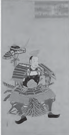
「伊達吉村像」 狩野古信筆/自賛 瑞巖寺蔵

個人の武士を描いた肖像画は鎌倉時代に現れるものの、本格的に制作され始めたのは南北朝・室町時代以降であり、室町時代後期から桃山時代にかけてその数が急激に増える。その特徴は、死後の追善のための肖像画だけでなく、長い贅を伴って武士個人や家の正統性を主張するものが見られるようになる。さらに、江戸時代前期から中期にかけて、各藩では大名の歴史書等の編纂が行われるようになると、江戸時代以前の遠い祖先の肖像画も描かれるようになる。これは、家の正当性を主張するために編纂した系図や家譜に、絵画的イメージを付加する役割があったのではないか。この章では、武家と肖像画の関わりを考える。