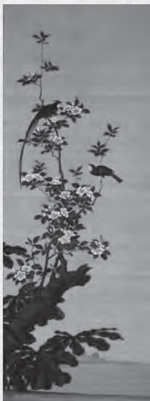
重文「唐太宗・花鳥山水図(三幅対)」 小田野直武筆 秋田県立近代美術館蔵 *前期展示(10/9~11/7)

江戸時代中期の18世紀には、博物学が世界的に流行し、日本に於いても武士を初め、学者、商人、豪農に至るまで、さまざまな人々が博物学研究にいそしんだ。その中でも、大きな役割を果たしたのが各地の大名である。彼らによって、さまざまな物を写生・模写した博物図譜が制作されるが、その目的に最も合致したのが、長崎に来日した中国人画家沈南蘋(しんなんびん)の画風である。沈南蘋は、写実を旨とした細密な花鳥画で知られ、本人はわずか二年で帰国したものの、日本の絵画界へ与えた影響は甚大で、瞬く間に南蘋風の絵画が日本中に広がった。さらに、秋田藩の小田野直武は、南蘋派の技法を取り入れつつ、それに洋画の技法を融合させた「秋田蘭画」と呼ばれる領域を確立した。このように18世紀の日本では、新たな絵画へ多くのまなざしが向けられ、近代絵画への道のりが既に始まっていたのである。