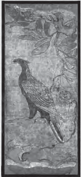
重文「瑞巖寺本堂障壁画 欄に鷹図(鷹)」部分 七面の内 狩野左京弟子九郎太筆 元和八(1622)年 瑞巖寺蔵