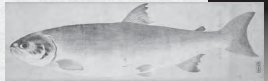
「鱒図」小田野直武筆 秋田県立近代美術館蔵