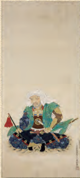
「伊達朝宗像」 伊達吉村筆 満勝寺蔵