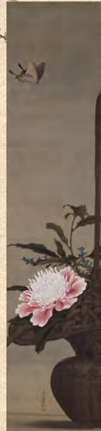
秋田県指定「芍薬花籠図」 小田野直武筆 秋田県立近代美術館蔵 *後期展示(11/9~12/5)