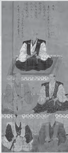
「留守政景および殉死者像」虎哉宗乙 慶長十五(1610)年賛 大安寺蔵(岩手県奥州市)