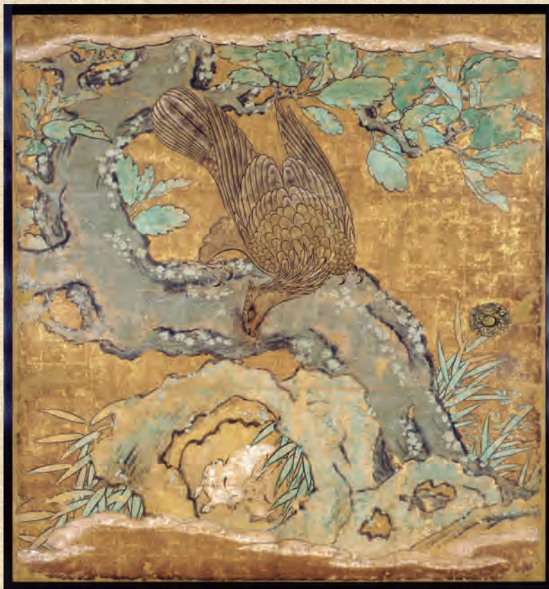
重文 瑞巖寺本堂障壁画「櫺に鷹図(鷹に兎)」七面の内 狩野左京弟子九郎太筆 元和八(1622)年 瑞巖寺蔵