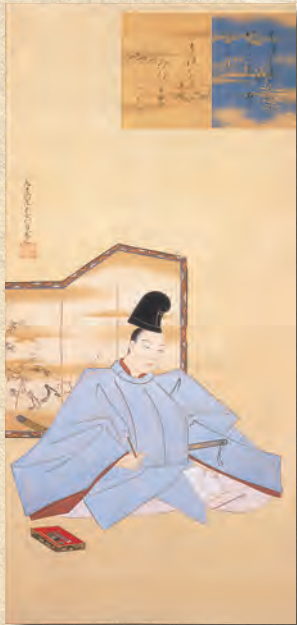
「伊達吉村像」 伊達吉村筆/自賛 仙台市博物館蔵