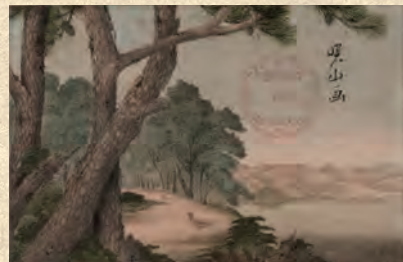
「湖山風景図」 佐竹曙山筆 秋田市立千秋美術館蔵 *前期展示(10/9~11/7)