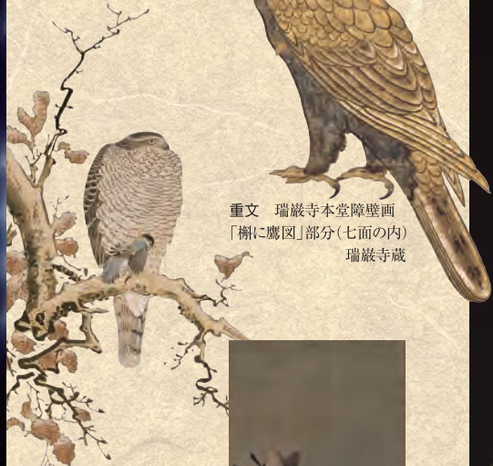
重文 瑞巖寺本堂障壁画 「櫺に鷹図」部分(七面の内) 瑞巖寺蔵