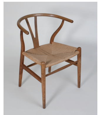
●ハンス・ウエグナー 椅子 CH24〈ウィッシュボーンチェア/Y-チェア〉 [1950] カール・ハンセン&サン 個人蔵

※新型コロナウイルス感染症対策のため、日程・関連企画の変更、及び入場制限を行う場合がございます。詳しくはホームページでご確認ください。 ※本特別展の半券提示で、宮城県美術館「足立美術館展—横山大観、竹内栖鳳、華やかなる名品たち」会期：2021年4月24日(土)～6月6日(日)を100円割引でご覧いただけます。[宮城県美術館窓口にお持ちください。]