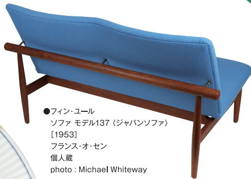
●フィン・ユール ソファ モデル137〈ジャパンソファ〉 [1953] フランス・オ・セン 個人蔵