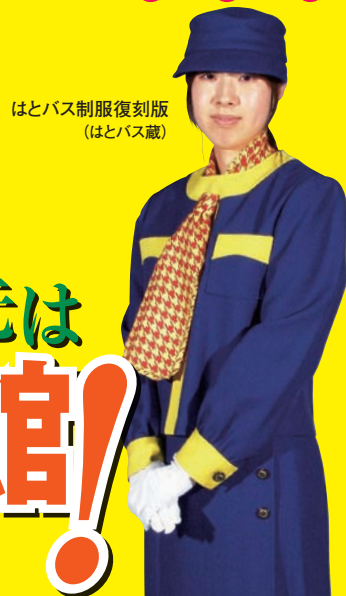
はとバス制服復刻版

開館時間 9:30 ~ 17:00 (入館は16:30まで) 休館日 祝日を除く月曜日と7月17日(火) 観覧料 一般・大学生 500円(400円) シルバー 400円(320円) 高校生 無料 小・中学生 無料 ※( )内は20名以上の団体料金