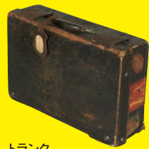
トランク (東北歴史博物館 ・菊田コレクション)