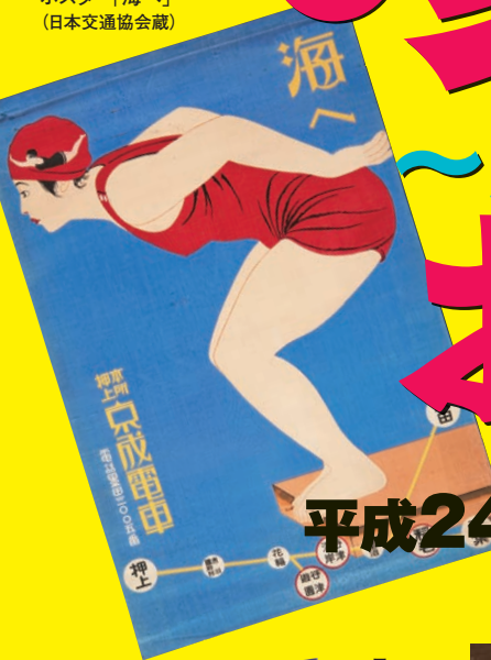
ポスター「海へ」