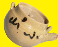
汽車土瓶 (益子町教育委員会蔵)