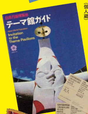
日本万国博覧会記念品 (個人蔵)