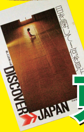
デスカバー! ジャパンポスター (鉄道博物館蔵)