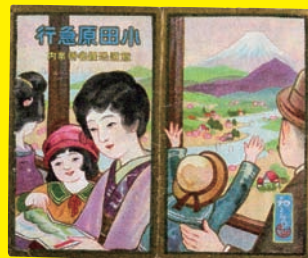
小田原急行鉄道沿線名所案内 (個人蔵)