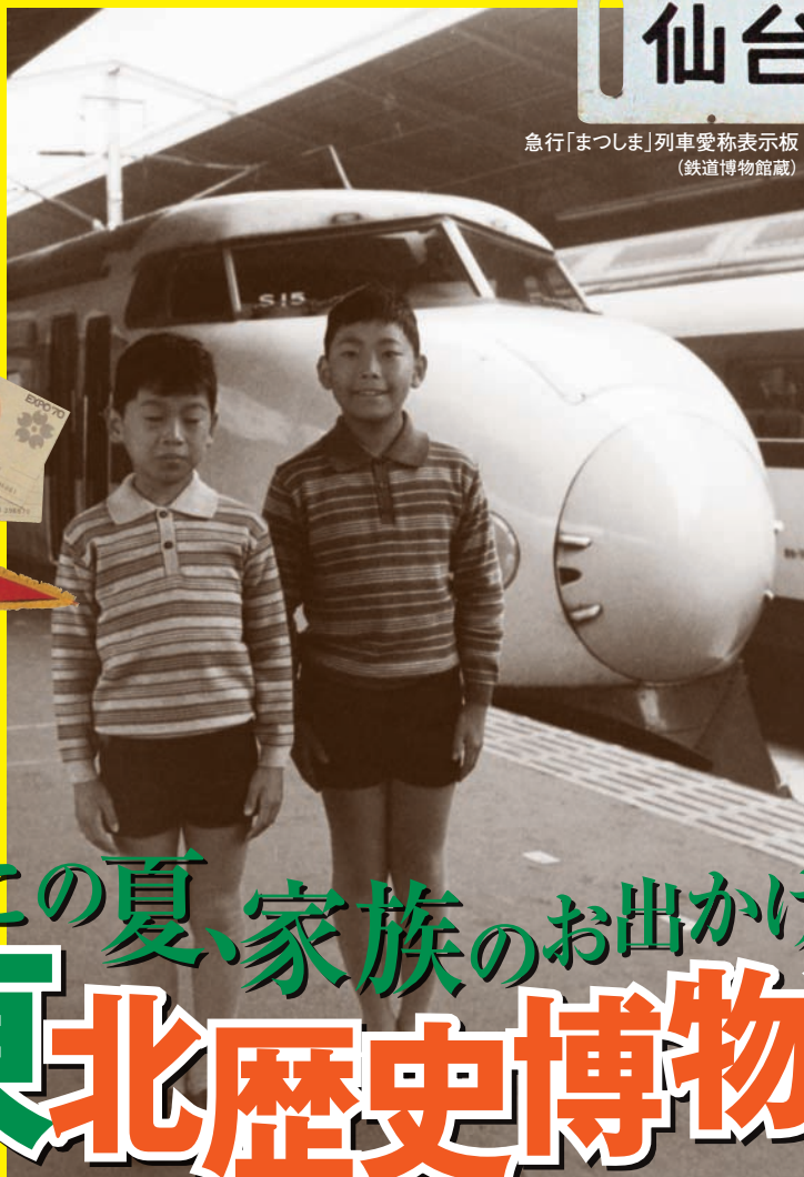
急行「まつま」列車愛称表示板 (鉄道博物館蔵)