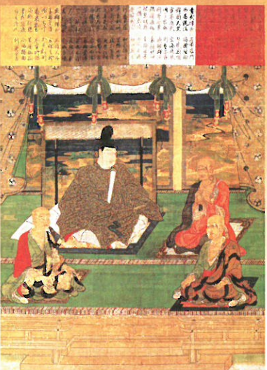
① 重文 四聖御影（永和本） 東大寺蔵 大仏造立を発願した聖武天皇、大仏開眼の導師を務めた菩提樹那、大仏造立の勧進を担った行基菩薩、東大寺初代別当を務めた良弁僧正を描く。