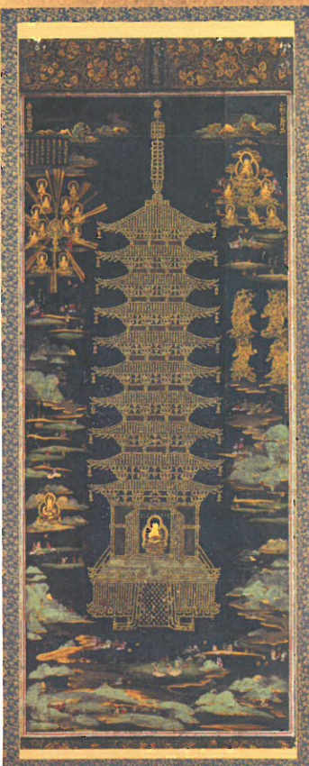
⑥ 国宝 金光明最勝王経金字宝塔曼荼羅圖 中尊寺蔵 紺紙に金泥で「金光明最勝王経」を宝塔の形に書写したもの。平安時代の作で、陸奥国産の金を使用していると思われる。

A special exhibition praying for recovery from the Great East Japan Earthquake Todayji and Tohoku: The People's Prayers for Recovery