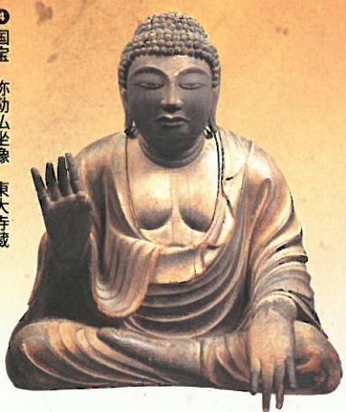
④ 国宝 弥勒仏坐像 東大寺蔵 小像ながら量感に富んだ堂々たる姿を大仏造立の雛形に見立てて「試みの大仏」との通称がある。