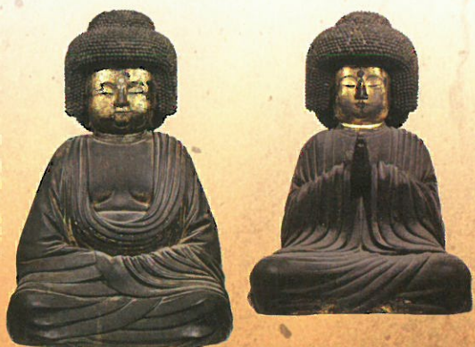
⑬ 重文 五劫思惟阿彌陀如来坐像（右）東大寺蔵（左）五劫院蔵 永遠とも思われる長い間、思惟をこらして修行をした結果、髪の毛が伸びて螺髪を積み重ねた姿となった。重源上人が宋から請来したとされる。