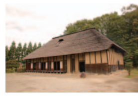
宮城県指定文化財・今野家住宅

宮城県内には、国の重要文化財に指定された民家が5棟あり、当博物館にも県指定の文化財である今野家住宅が移築・復元されています。本講座では、県内の指定文化財の民家を中心に、その特徴や間取り・構造の基礎知識など、古民家のみかたをご紹介します。