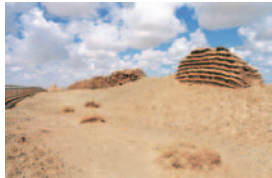
漢代長城と当谷隧（大阪府立近つ飛鳥博物館）

「のろし」は煙や炎で情報を伝達する古来の通信システムです。古代中国で体系化され、日本でも江戸時代まで利用されました。律令政府とエミシの苛烈な戦いが繰り返された古代東北地方で「のろし」はどのように配備されたのか。謎の多いその実態に迫ります。