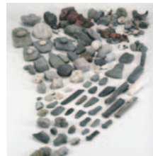
北小松遺跡からまとまって出土した石器など

木の実や種、動物や魚を食料としていた縄文人は様々な道具を使って暮らしていました。遺跡からはたくさんの種類の道具が出土しますが、中には何に使ったのかわからない道具も多くあります。特に石器について出土状況や素材など様々な観点から光を当てて考えます。