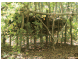
熊捕獲用の木製ワナ

江戸時代、人びとは盛んに狼と熊を獲っていました。鉄砲はもちろんのこと、やり、毒薬、ワナなども使っていました。捕獲方法を示した記録が弘前藩、盛岡藩、八戸藩などに数多く残されており、その記録をもとにして江戸時代に行われていた狼と熊の獲り方を考えてみます。