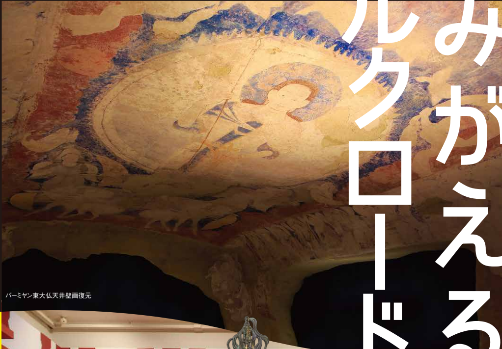
バーミヤン東大仏天井壁画復元