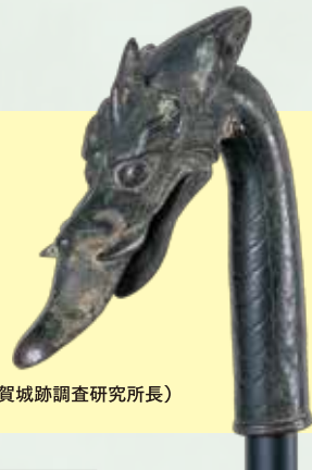
岩手県北上市 極楽寺伝世 銅竜頭[重要文化財] (極楽寺 所蔵)