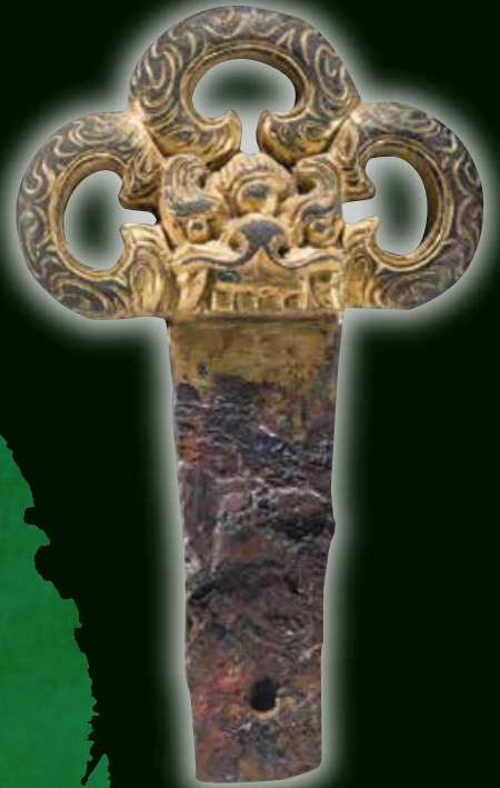
青森県八戸市丹後平古墳群出土 金装獅喙三果瓊頭大刀柄頭【重要文化財】 (八戸市 所蔵, 撮影 小川忠博)