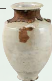
岩手県平泉町 柳之御所遺跡出土 白磁四耳壺[重要文化財] (岩手県教育委員会 所蔵)