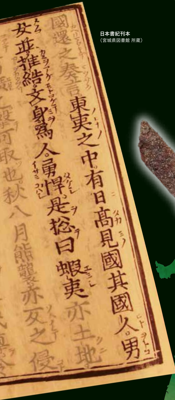
日本書紀刊本 (宮城県図書館 所蔵)