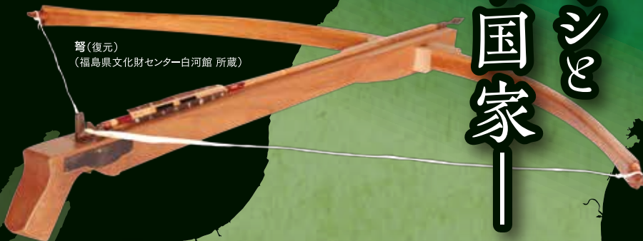
弩(復元) (福島県文化財センター白河館 所蔵)