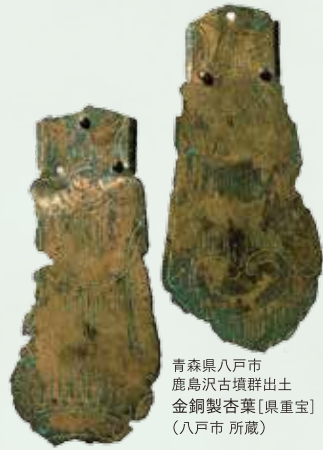
青森県八戸市 鹿島沢古墳群出土 金銅製杏葉(銅重宝) (八戸市 所蔵)