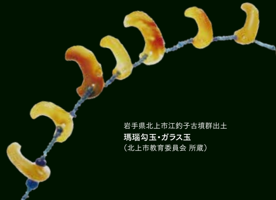
岩手県北上市江釣子古墳群出土 瑪瑙勾玉・ガラス玉 (北上市教育委員会 所蔵)