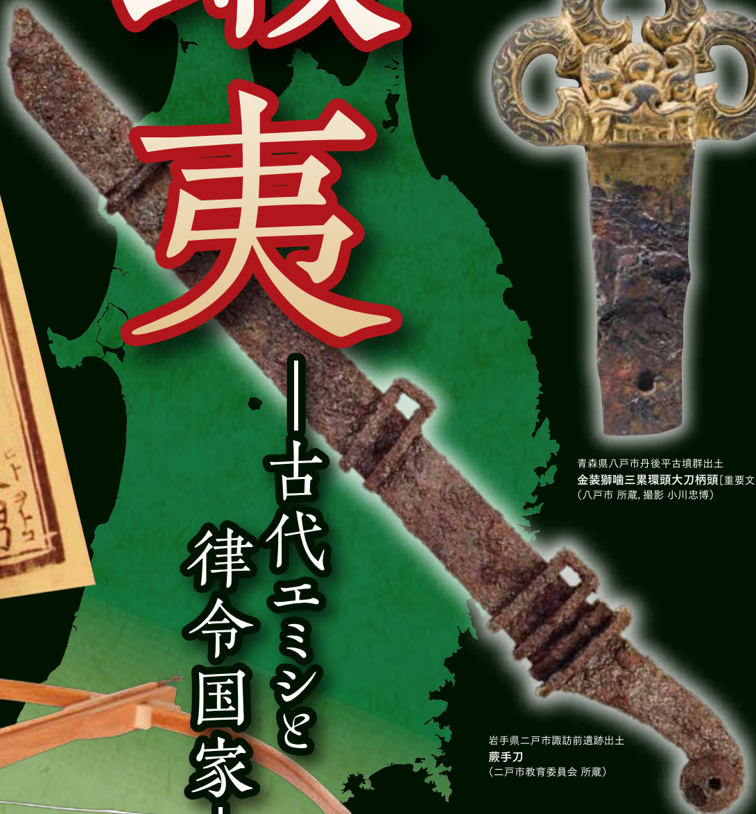
岩手県二戸市諏訪前遺跡出土 藤手刀 (二戸市教育委員会 所蔵)