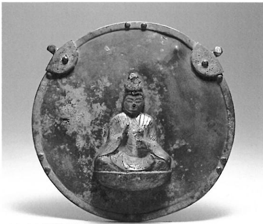
聖観音菩薩坐像懸仏 重要文化財 鎌倉時代 第015号 高館熊野那智神社 名取市