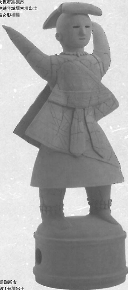
大阪府高槻市 史跡今城塚古墳出土 巫女形埴輪