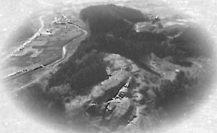
宮城県南三陸町 新井田館跡全景