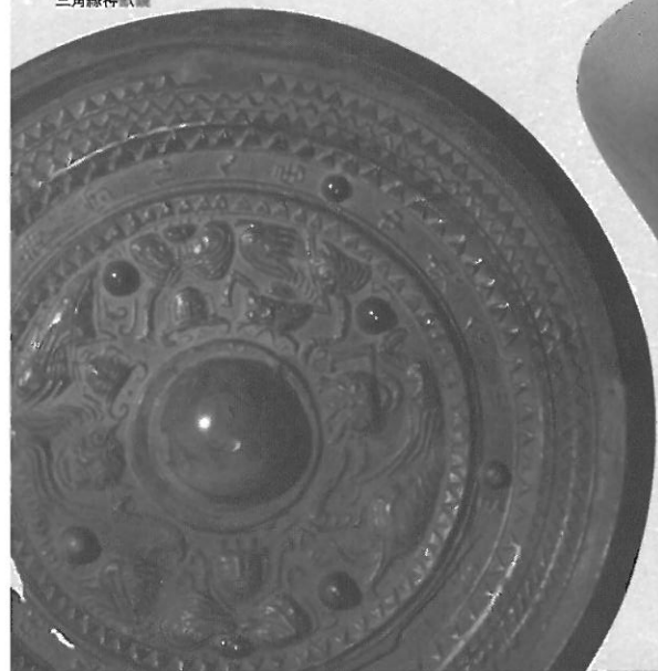
奈良県御所市 鴨都波1号墳出土 三角縁神獸鏡