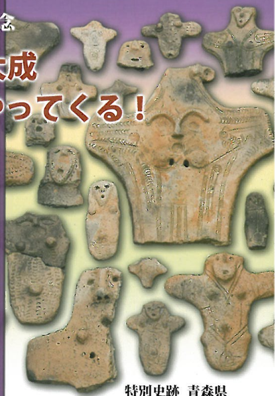
特別史跡 青森県 三内丸山遺跡