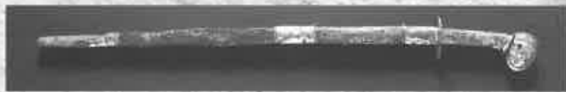
頸椎大刀 (古墳時代 宮城県山田遺跡)