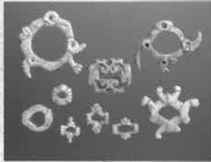
重要文化財 鹿角製腰身具(縄文時代 宮城県沼津貝塚)