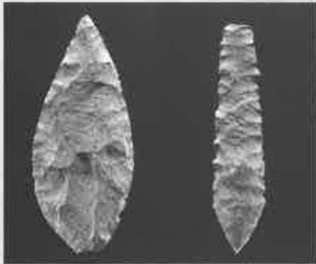
矢鏃器(晩期旧石器時代 新潟県田代遺跡)