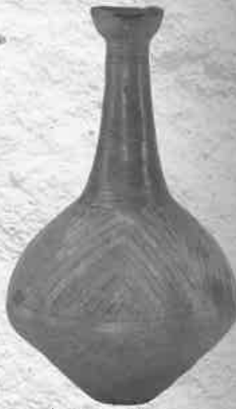
亞形土器(弥生時代 宮城県高宮遺跡)