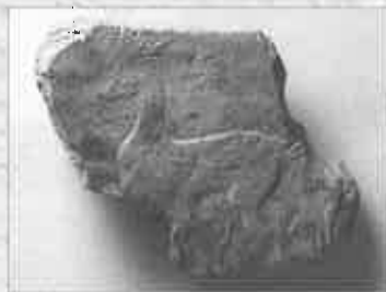
鹿文埴 (平安時代 宮城県多賀城跡)