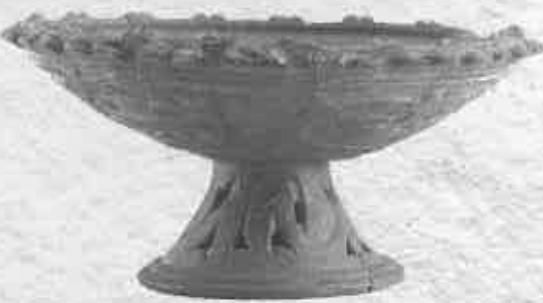
重要文化財 古付浅鉢形土器(縄文時代 宮城県沼津貝塚)