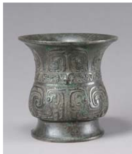
酒を入れるつぼ ◎《「豊」銅尊》西周時代 宝鶏市周原博物館