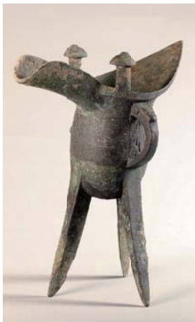
酒を温める道具 ◎《「光父辛」銅爵》商時代 安陽博物館