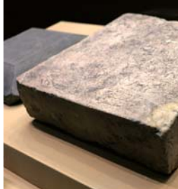
最古の「日本」国名 《井真成墓誌(複製)》唐時代 藤井寺市教育委員会(原資料 西北大学博物館)