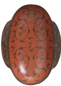
漆塗りの酒杯 ◎《「一升」「君幸酒」雲紋漆耳盃》前漢時代 湖南省博物館