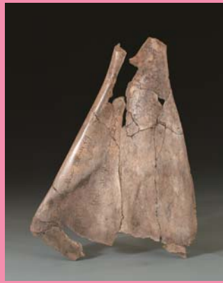
殷墟の甲骨文字 ◎《「歳于中丁」卜辞牛胛骨》商時代 安陽博物館