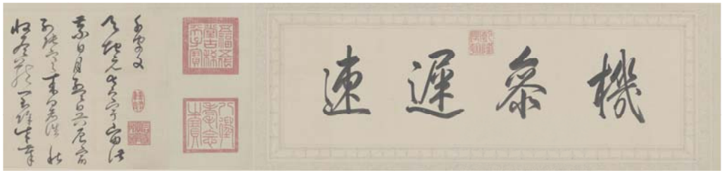
草書の秘訣「機參運速」 弘歴(乾隆)《草書臨蘇軾千字文卷》清時代 故宮博物院