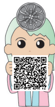
れんげもんちゃん

電子申請で申し込めない場合は、下記までお問い合わせください。 電話：022-368-0102 FAX：022-368-0104 E-mail：tagajo_lab@pref.miyagi.lg.jp