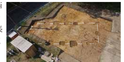
写真5 掘立柱建物2(南東から)

掘立柱建物2は、東西6間(15.8m)、南北2間(5.9m)の建物で、南西部以外の14個の柱穴を確認しました(第3図、写真5)。柱間は約2.0~3.0mです。1度建て替えられています。柱穴は一辺0.5~1.6mの方形、長方形、楕円形で、深さが50~80cmです。年代は、出土した土器から9世紀中頃以降の政庁第III期以降と考えられます。