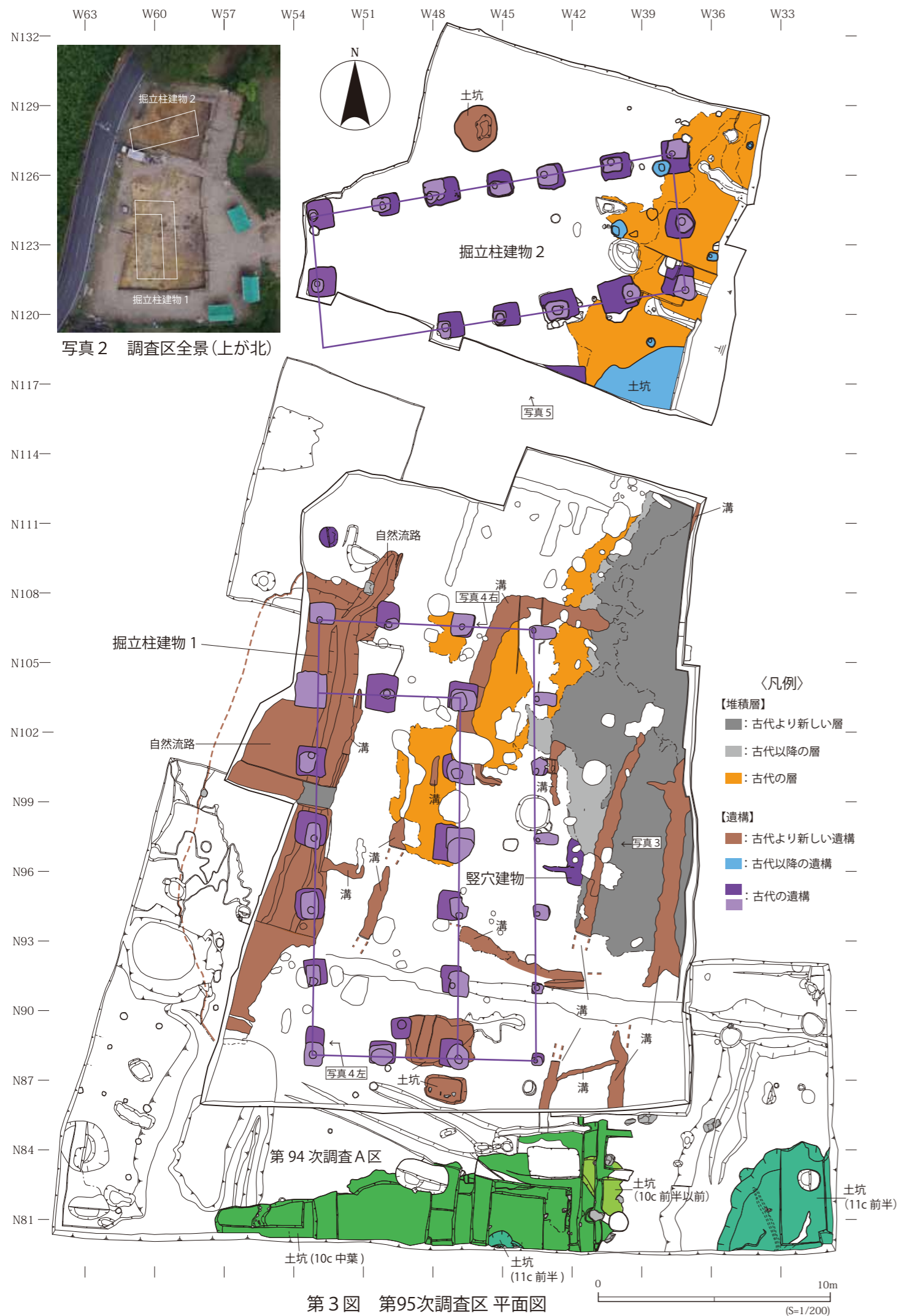
写真2 調査区全景(上が北)