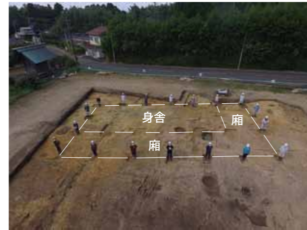
写真3 掘立柱建物1(東から)

掘立柱建物1は、昨年の調査で一部を確認していたもので、今回の調査により全体が明らかになりました。柱を据えるための穴(柱穴)を24個確認し、南北5間、東西2間の身舎の東側と北側に廂が付く建物で、規模は南北18.7m、東西9.6m、柱と柱の間隔(柱間)は約3.0~3.3mです(第3図、写真3)。1度建て替えられています。建物の西辺は政庁西辺築地塀の北側延長上に(第2図)、北辺は政庁正殿から約108m北(第3図)に位置しています。年代は、柱痕跡に10世紀前葉に降下したとされる十和田a火山灰が含まれることから、政庁第IV期と考えられます。