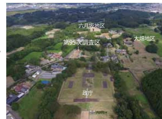
写真1 第95次調査区遠景(南から)

今回の調査の主な成果は、平安時代と考えられる掘立柱建物を2棟発見したことです。以下では、これらの建物について詳しく説明します。