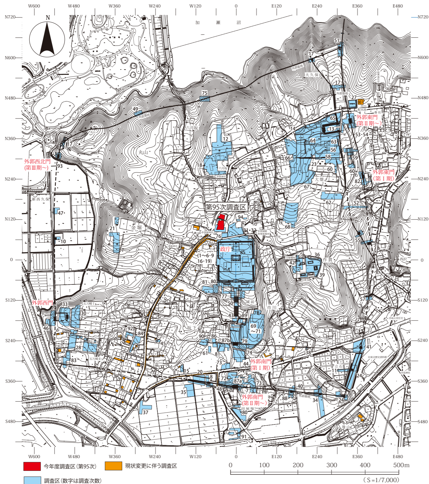
第1図 第95次調査区の位置

宮城県多賀城跡調査研究所では、昭和44年以来、特別史跡多賀城跡の発掘調査を計画的に実施し、遺跡の実態解明に向けた研究を進めています。今年度は、昨年度に引き続き多賀城政庁北側の政庁地区北方を対象に、第95次調査を実施しています(第1図)。今回の調査の目的は、政庁北側の遺構の分布や構成等を把握することです。