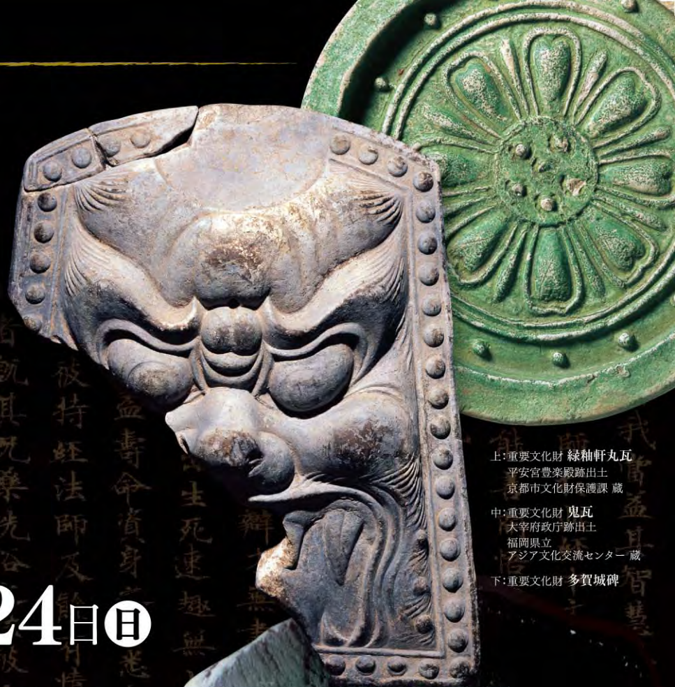
上:重要文化財 緑釉軒丸瓦 平安宮豊楽殿跡出土 京都市文化財保護課 蔵 中:重要文化財 鬼瓦 大宰府政庁跡出土 福岡県立 アジア文化交流センター 蔵 下:重要文化財 多賀城碑

解明される 古代東北統治の拠点 古代律令国家の外交と地方支配を担った 東の多賀城・西の大宰府。 そして平城京・長岡京・平安京などの 考古・歴史資料を一堂に会して 多賀城の真実を解き明かす。