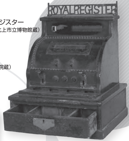
レジスター (北上市立博物館蔵)