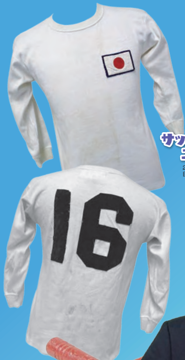
サッカー日本代表 ユニホーム