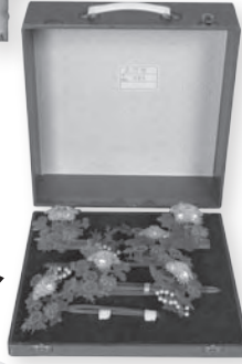
日本髪と かんざし (せつ総合美容院蔵)