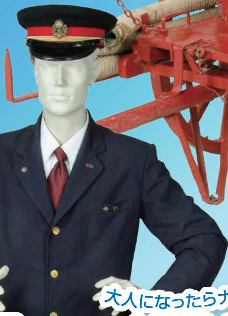
栗原電鉄制服 みちのく風土館蔵