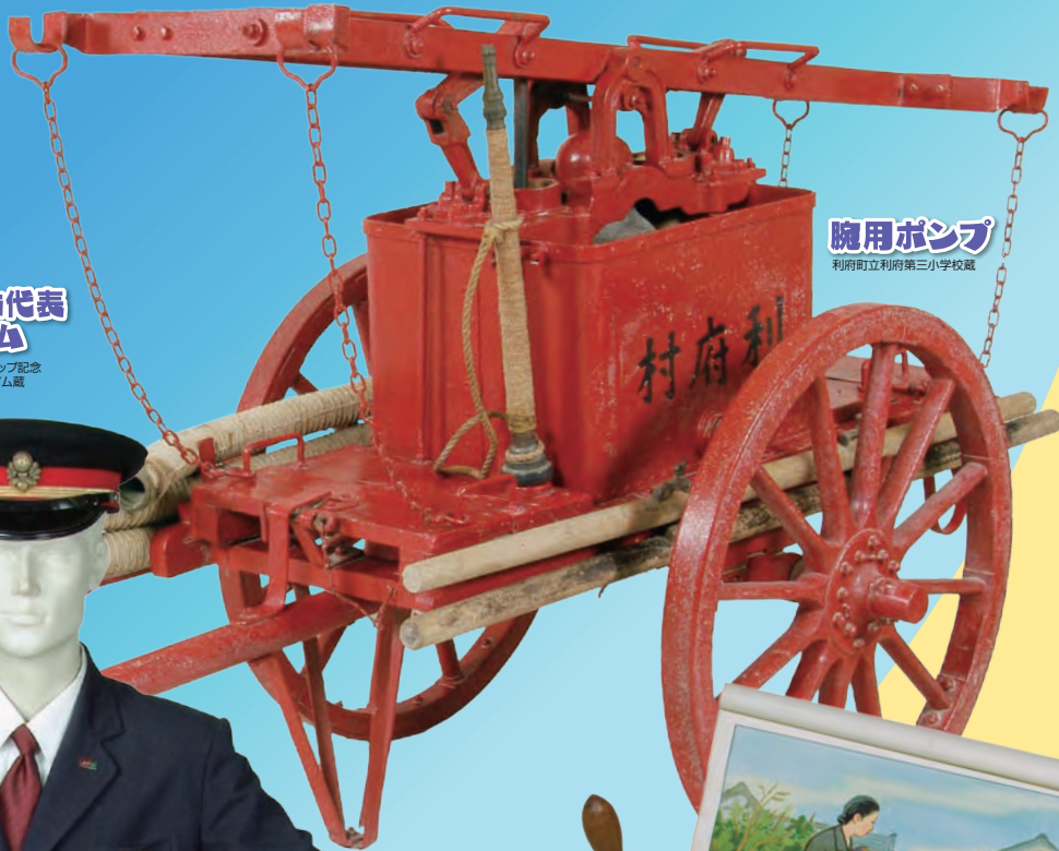
腕用ポンプ 利府町立利府第三小学校蔵