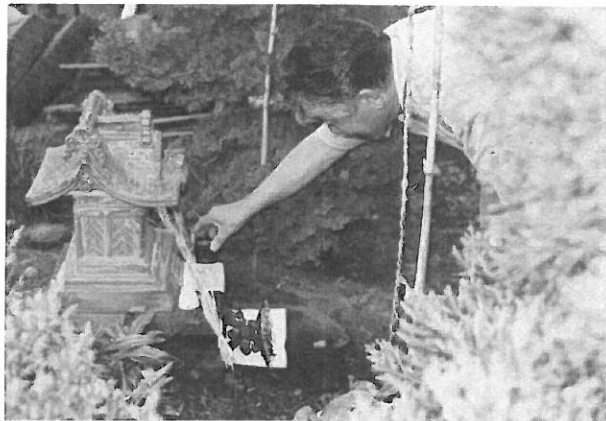
ミグニチ 大崎市古川米倉

家で行う稲の収穫行事は9月になってから行われる。9月の9日、19日、29日の3回の9のつく日は「ミグニチ」といって、稲の収穫を屋敷神(家の氏神・お明神さま)に感謝する日である。栗原市栗駒ではこれを「お駒精進講 こましようじんこう (栗駒山の神に収穫を感謝する講)」・