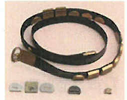
(石製・金属製の飾りと、 復元された腰帯)