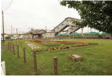
駅の脇を彩る 花壇建物表示