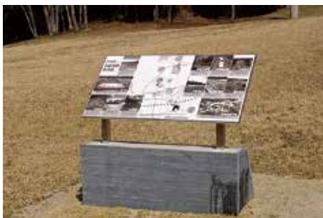
総合案内板 (政庁南面地区)