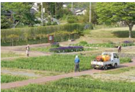
あやめ園 の管理作業