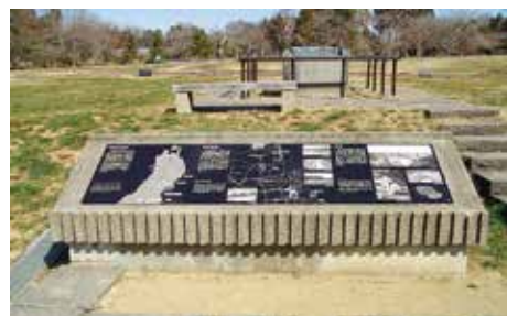
史跡説明板 (政庁地区 平成 17 年撮影)

多賀城跡調査研究所では、昭和 53 年度から地区・遺構説明板の仕様とデザインを統一し、原則として遺構の発掘状況の写真、その推定復元図あるいは参考資料を組み合わせレイアウトしている。整備区域の園路沿いに 25 基設け、説明内容と現地が直接対応できるように設置場所と方向に配慮している。