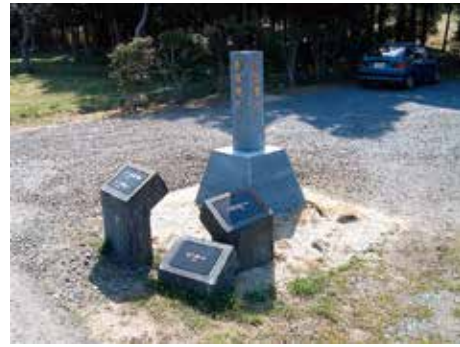
地区名標識と 誘導標識 (作真地区)