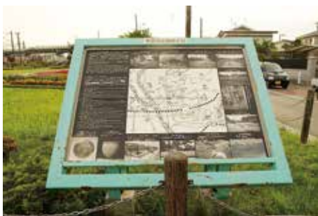
総合案内板 (陸前山王駅前)

その他、広く多賀城市内の歴史遺産を紹介する案内板も、多賀城市が政庁跡北側の管理事務所脇、多賀城廃寺跡等に設置している。