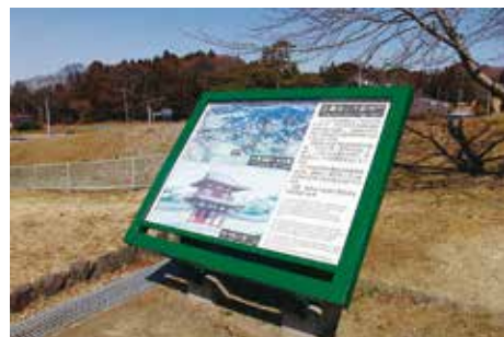
遺構説明板 (南門 平成 17 年撮影)