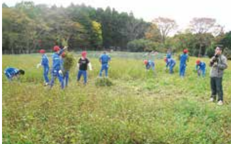
歴史的食文化 体験学習 (市教委提供)

ソバの開花時には一面が白い花で覆われ、未整備公有地の景観を良好なものとしている。