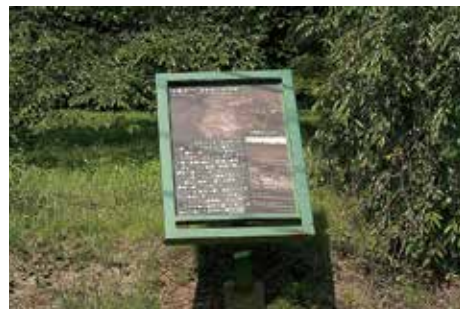
地区説明板 (六月坂地区)