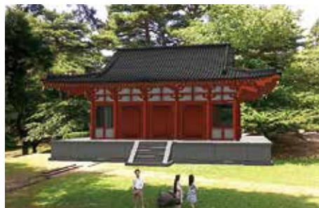
多賀城 廃寺跡にて