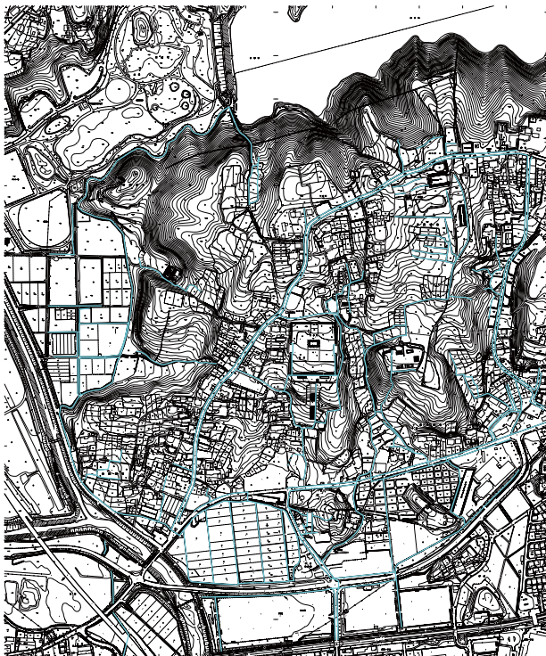
図 42 排水路・用水路の現況

大畑地区では、一部が丘陵東斜面の林地に排水されているものの、ほとんどの雨水は政庁地区 さつかん と作貫地区の間の沢に集められている。これらは、南門地区東側の湿地（あやめ園）を経て県道泉塩釜線の側溝に排水されている。作貫地区からの雨水でも同様な処理が行われている。しかしながら、雨量が多い場合には作貫地区南側の道路や住宅地に溢れ出すことがしばしばある。冠水や浸食を防ぐために排水施設の改善が必要である。