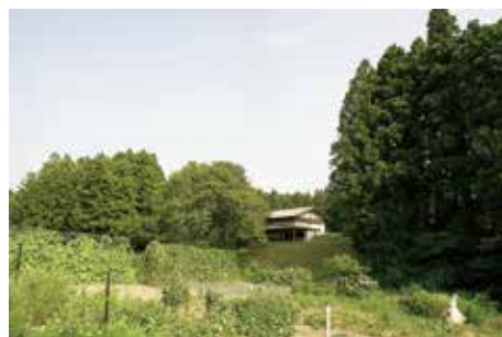
北側の耕作地 と覆屋