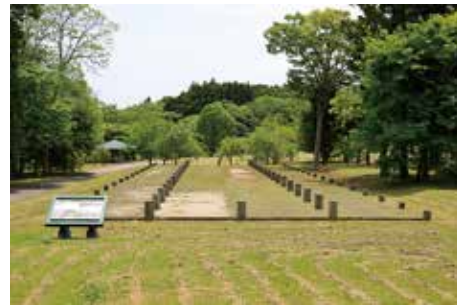
掘立柱建物の 表示 (大畑地区)