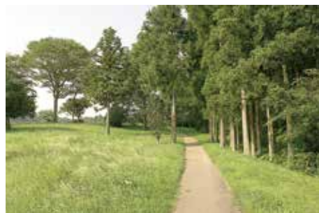
大畑地区への 連絡園路