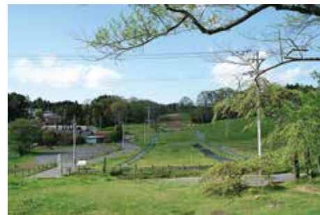
政庁南面地区の現況

多賀城跡においては、これまで 40 年以上に渡って整備事業を実施し、政庁地区をはじめいくつかの地区で建物跡の平面表示等を実施してきた。しかしながら、政庁地区とともに多賀城の中軸を形成する政庁南面地区と南門地区の整備については、早くから計画に載せて実施を目指してきたが、諸般の事情により実現にいたっていない。したがって、古代の多賀城を実感できる歴史的空間の整備は不十分であると言わざるを得ない状況である。