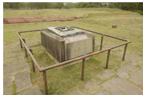
政庁建物 配置模型 (政庁地区)