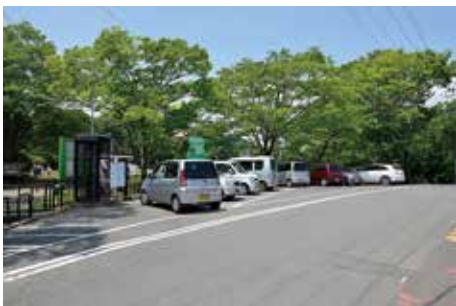
駐車場 (多賀城廃寺跡)

多賀城跡への来訪者は自動車を利用する機会が多いため、導入口における駐車場は史跡利用にとって欠かすことのできない施設となっている。しかし、現状は多賀城廃寺跡と南門地区にごく狭い駐車場を、政庁の北東側に管理用を兼ねた駐車場を設けているのみである。指定地外では、南門地区南側の中央公園内に駐車場があるが、利用度が高く、特に休日には運動施設の利用者によりほぼ満車の状態となる。したがって、現在駐車場はかなり不足している状況で、団体来訪者の大形バスへの対応は特に不十分である。今後、S重点遺構保存活用地区の整備の進行とともに来訪者の相当な増加が見込まれるため、導入口への駐車場の設置が必要となる。その配置と規模は、歴史的な景観形成と利用の利便性の両面から検討する必要がある。