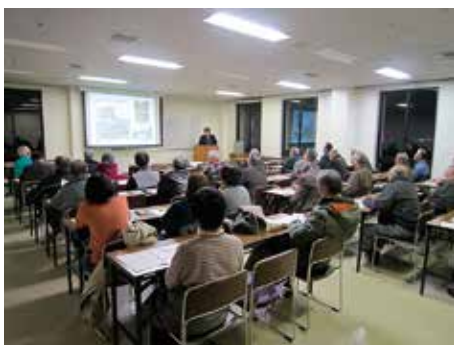
史都多賀城 歴史観光講座 (市教委提供)

多賀城市教育委員会では、多賀城市観光協会と共同して、平成20年度より多賀城跡のほか市内の歴史・文化財・観光資源についての講座を開催し、市民の歴史文化遺産に関する関心を高めるよう努めている。