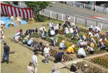
山王遺跡 千刈田地区 花壇づくり

しかしながら、公有化事業の進展により未整備公有地が増大し、維持管理経費が増加するとともに、居住者の減少により放火・器物損壊・不法投棄等の