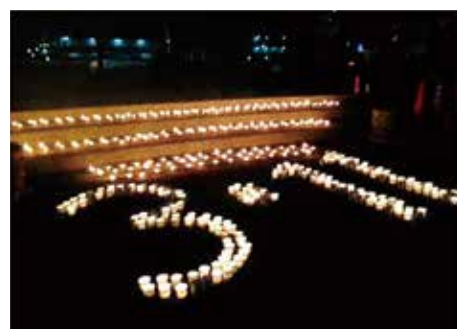
「多賀城・万灯会 鎮魂の灯」 (HPより)