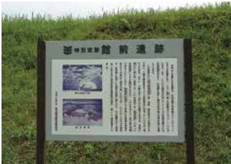
地区説明板 (館前遺跡、 市教委設置)

この他に、多賀城市教育委員会が、館前遺跡に2基、多賀城碑と山王遺跡千刈田地区に各1基を設置している。