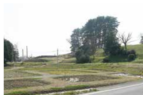
旧宅地造成地 (南門地区)