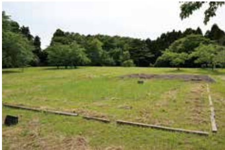
整備地と 周囲の林地

南東隅にある多賀神社には現在も奉納物が納められており、住民の信仰が続けられていることが伝わってくる。