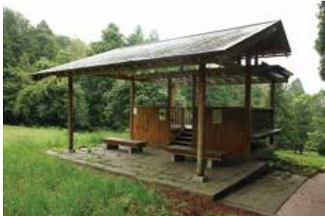
休息展望所 (作貫地区)

屋外ベンチを六月坂地区、南門地区、政庁地区、作貫地区、北辺地区、柏木遺跡等に設置しているが十分な数にはなっていない。また、一部では木材の腐朽が進んで改修が必要となっている。