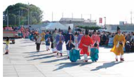
万葉行列

史都多賀城万葉まつり実行委員会が主催するもので、平成27年で17回目の開催となる。万葉集の編者の一人であり、奈良時代末近くに陸奥按察使・持節征東將軍の職について大伴家持を偲び、多賀城の歴史と未来を広く市民に語りかけるとともに、多