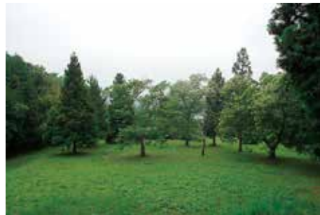
展望休憩所 南側のクリ林

東門あるいは市道北の四阿から南を眺望すると、手前の整備区域の奥に公有化された旧畑地が広がり、広大で開放的な景観がある。この空間の東と南は林地で区切られ、西は屋敷林が境界となって住宅の一部を遮蔽してくれている。