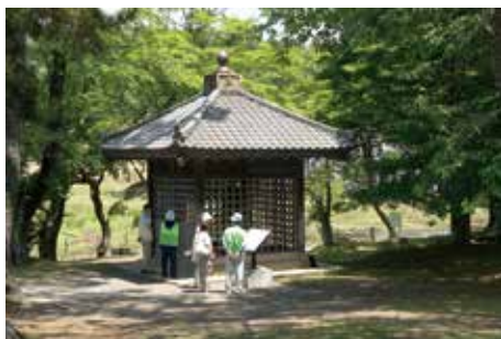
観光 ボランティア ガイド

後述する「多賀城市史跡案内サークル」も、特に団体に力を入れて史跡案内を実施しており、多賀城跡の見学ガイドは様々な形で活発に行われている。しかし、現地の主要な導入口におけるガイダンス機能は不足していると言わざるをえず、来訪者にわかりやすい場所に情報提供やガイド活動を行う拠点が必要である。