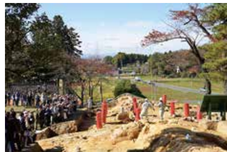
発掘調査 現地説明会 (平成 26 年度)

多賀城跡調査研究所では、発掘調査の見学者に対して随時説明を行うとともに、調査成果がまとまった段階で現地説明会を毎年開催している。多賀城市教育委員会も同様である。