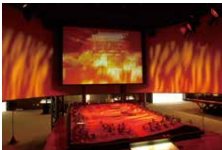
総合展示 「多賀城炎上」

多賀城市埋蔵文化財調査センターは、多賀城の南面に展開した「古代都市多賀城」の紹介を中心とすることで、東北歴史博物館と役割を分担している。