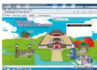
多賀城市観光協会 「日本三大史跡 歌枕の地を巡る」 (HPより)