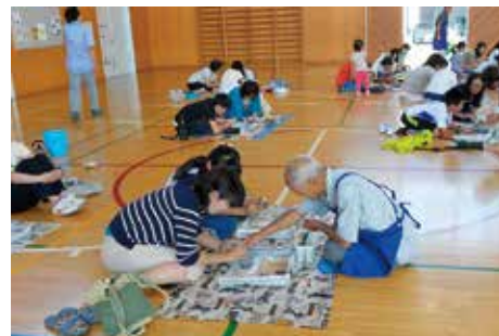
出前授業

また、東北歴史博物館でも県内全域が対象となるが、地域の歴史、文化財に関する出前授業を実施している。