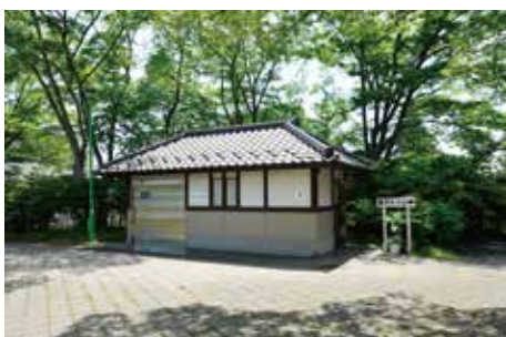
トイレ (多賀城廃寺跡)