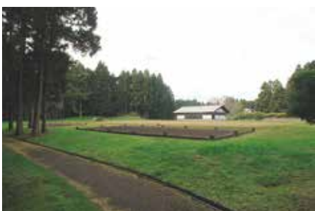
林地に 囲まれた 整備地

東門・大畑地区、作貫地区、政庁地区を繋ぐ連絡園路は、周辺住民の散策路として特に利用度が高い。この園路沿いには、既存の林地が外郭東辺周辺にあり、また修景のために植栽した樹木も適度な間隔で育っている。作貫地区北側で耕作が続けられている