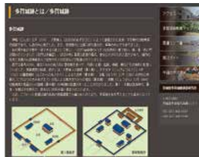
多賀城調査研究所 「多賀城跡とは」