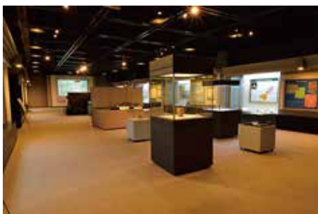
展示風景

多賀城市埋蔵文化財調査センターは、多賀城の南面に展開した「古代都市多賀城」の紹介を中心とすることで、東北歴史博物館と役割を分担している。