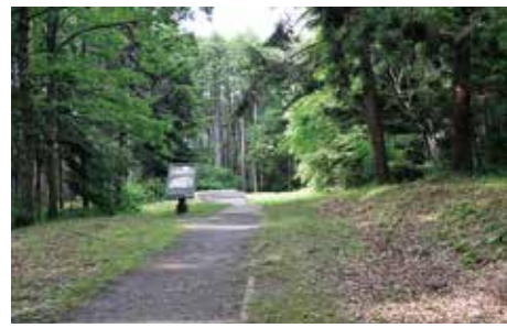
築地堀跡沿いの 連絡園路

北辺地区の園路と園路沿いの木々は、年間を通じて良く管理されており、築地堀跡の観察だけでなく林間の散策も楽しめる。途中には墓地もあり、住民が花を手向けた場面に巡り合うこともある。北端のデッキからは加瀬沼の眺望が期待されるが、現在は樹木の繁茂のためほとんど見ることはできない状態である。