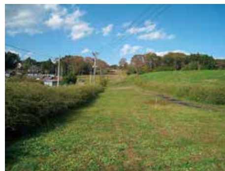
政庁南大路の萩植栽

これまで実践された事業には、史跡探索ツアーとワークショップの開催、政庁南大路の植栽表示、その周辺への花の植栽、灯籠による政庁南大路のライトアップ(万葉まつり前夜祭)、東日本大震災追悼イベント「多賀城・万灯会 まんどらえ 〜鎮魂の灯〜」の開催などがあり、多賀城跡を市民に広く知ってもらおうとする事業を活発に行っている。また、活動の中から、多賀城跡の魅力と改善すべき課題を市民の目から提案している。