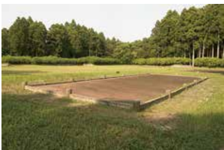
掘立柱建物の 表示 (作貫地区)