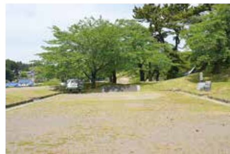
南門跡周辺の現況