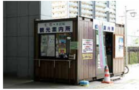
史都・多賀城 観光案内所

鉄道を利用する場合には、JR 東北本線国府多賀城駅が最寄りの駅となる。ここには現在多賀城市の観光案内所があり、ボランティアにより多賀城跡の