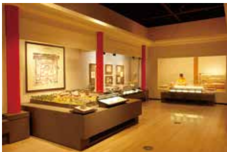
古代詳細展示 「多賀城と その周辺」

東北歴史博物館では多賀城跡と多賀城廃寺跡に関して、特に詳細展示ゾーンを設けて主要な出土遺物を展示し、総合展示中央部では蝦夷の蜂起を扱った映像展示も行っている。