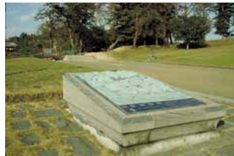
地形模型 (南門地区)

野外模型としては、南門南側の南北大路脇に多賀城全体の地形模型(1/1,000)を、政庁南門脇に政庁の建物配置模型(1/200)を、作貫地区の中央西側に遺構検出状況の模型(1/70)を設置している。表現上の制約はあるものの、立体的な模型と現地を対照させることによって、より正確な理解や当時のイメージを描き出す効果が得られている。いずれも設置から30年以上が経過しているが、銅合金製であることから特段の劣化は見られない。ただし、説明プレートには腐食や傷が生じるため、これまでも修理を行ってきた。なお、政庁の建物配置模型は、再調査による建物配置の理解の変更に基づき平成23年度に改修を行っている。