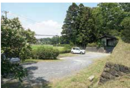
駐車広場 (南門地区)