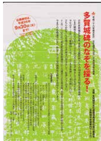
「多賀城碑のなぞを探る！」

多賀城市教育委員会が実施した「史跡案内ボランティア養成講座」の受講者によって平成5年に結成された団体である。前述の史跡案内以外に、勉強会や野外研修の実施、定期機関誌「いしぶみ」の発行、史跡周辺の清掃、講演会等の開催等、長い活