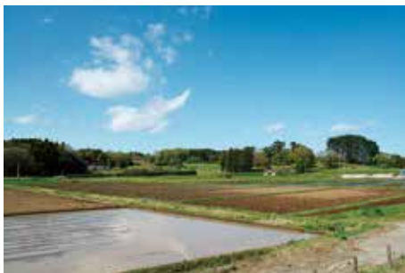
県道泉塩釜線 からの眺望

県道泉塩釜線と市道水入線の交差点から西へ100m～200m程離れた場所からは、南辺築地堀跡の植樹表示とともに、南門地区から政庁地区の南端までの範囲を見渡すことができる。しかし、現状では、トイレ脇のスギ林が築地堀跡を隠し、その南の石垣、南端部にある宅地跡の擁壁、市道水入線沿いの電柱、アパート等が景観を阻害する要因となっている。