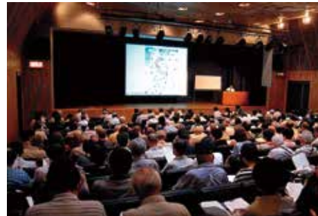
東北歴史 博物館 館長講座

東北歴史博物館では、開館以来年間10～15回の館長講座を実施している。歴代館長は、文献史学・考古学それぞれの立場から多賀城を中心に据えた東北古代史をテーマとして講演を行ってきた。