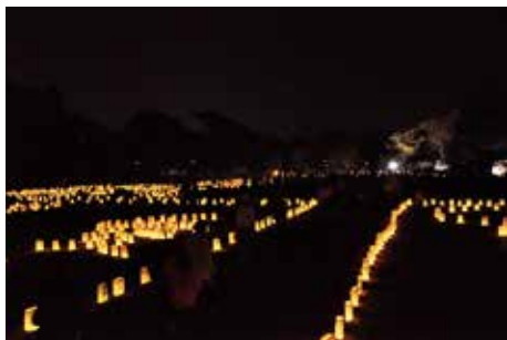
アラハバキの灯 (平成23年)

平成22年から万葉まつりの夜に塩釜青年会議所が主催する「アラハバキの灯」が多賀城政庁跡で開催されている。これは、身近にある多賀城跡に足を運んでもらい、地域の宝を再認識し、郷土愛を育むきっかけをつくることを趣旨としたものである。竹行灯と小学生が作った紙行灯で政庁跡を照らし、野外コンサートや体験コーナーも開催される。幻想的な雰囲気の中に浮かびあがった政庁跡は、参加者に多賀城跡の存在を強く印象づけている。