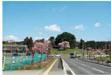
東北本線踏切 からの眺望

当然ながら多賀城跡の正面が見えるはずであるが、現状はJRの線路施設がこれを阻害している。