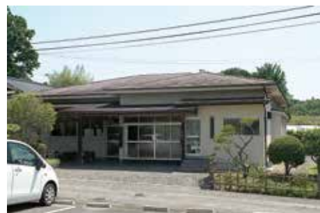
多賀城跡 管理事務所

政庁跡の北側に多賀城跡管理事務所が昭和53年に設置され、管理人の待機所及び倉庫、市川地区の集会所の複合施設として利用されている。多賀城廃寺跡には遺物の収納、展示や整備後の管理のため収蔵庫が昭和43年に建てられた。現在は施設が老朽化していることもあって、維持管理のための施設としての利用にとどまっている。管理運営用の広場は整備地各所で不足している状況にある。