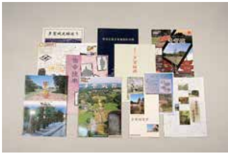
多賀城跡紹介 パンフレット

また、いずれの機関においても、史跡を紹介するパンフレットや見学マップを随時改訂しながら作成し、広く配布を行っている。