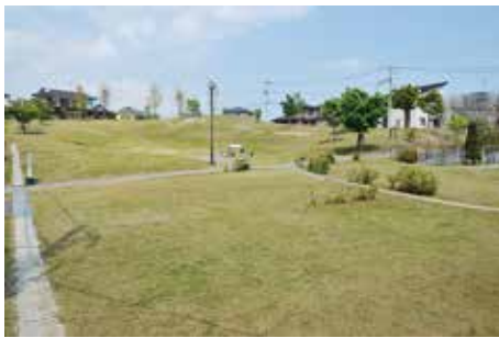
住宅に 囲まれた 整備地