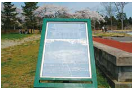
説明板の劣化 (政庁正殿)

案内板・説明板・標識は、基本的に各地区の整備時に設置してきた。しかし、設置後年月を経るうちに、材料の劣化やいたずら等により、来訪者の利便に供する目的が果たせないものが生じている。平成9年度には劣化・破損したものの修理を実施し、平成17年度には、史跡東半部において改めて全体の配置計画を検討し、これらの新設あるいは全面的改