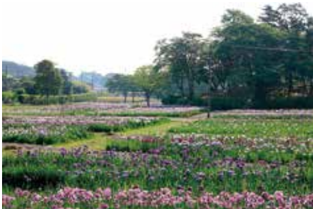
多賀城跡 あやめ園