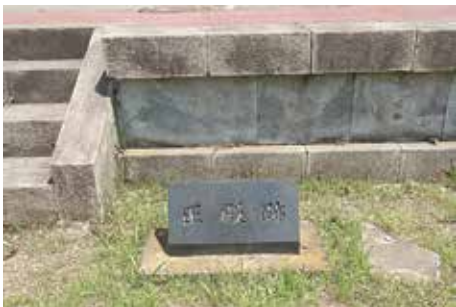
遺構標識 (政庁正殿跡)

表示した遺構についてその名称及び簡単な説明を記したものである。素材には御影石 みかげいし を使用して仕様を統一している。