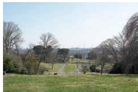
政庁南門跡 からみた 政庁南面地区

政庁南門跡から南には、眼下に城前地区・政庁南大路・鴻の池地区・南門地区が見える。その奥には仙台平野が広がり、好天に恵まれれば平野を画する丘陵も眺望することができる。しかしながら、三陸自動車道、鉄塔、マンション等の近代的建造物が目に付いてしまう状態である。