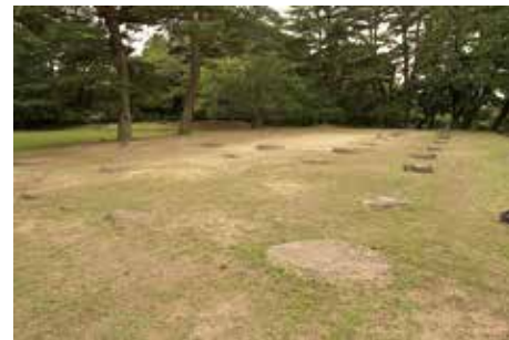
露出展示した 礎石 (廃寺講堂跡)

礎石は、政庁地区、東門・大畑地区、六月坂地区、多賀城廃寺跡において以前から地表に見られていたため、これらの保存を期して整備が行われた。その方法は、建物跡の遺構面に盛土をした上で礎石を露出させ、それを平面表示に取り込むものである。現在まで礎石に目立った損傷は認められず保存状況は良好である。