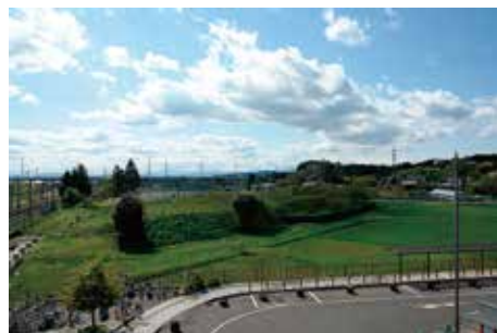
国府多賀城駅 からの眺望