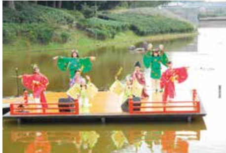
万葉踊り

賀城の魅力を発信することを目的としている。東北歴史博物館等を会場に、万葉衣装を身につけての万葉行列をはじめ、家持の歌の朗詠、雅楽の演奏、万葉踊りの披露などが行われ、市民が古代多賀城の雰囲気