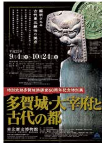
発掘調査 50 周年記念展リーフ

分館である多賀城史遊館では、さまざまな体験メニューを常に用意し、ボランティアの支援を受けながら随時参加を受け付けている。