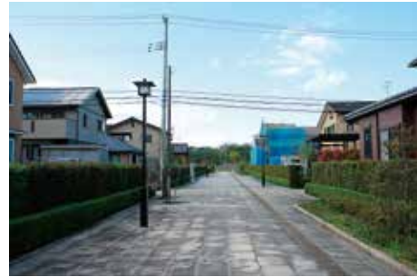
城南住宅街 南北大路 からの眺望

三陸自動車道と砂押川 すなおし の堤防上の道路（市道 なごそ 名古曾線）からは、多賀城跡の西側部分の地形が良く観察できる。この区域ではこれまで整備を行っていないが、将来、西辺の材木堀跡や櫓跡 やぐら 等を表示することにより、西側においても多賀城跡の位置と広さを示す歴史的景観を形成することができよう。