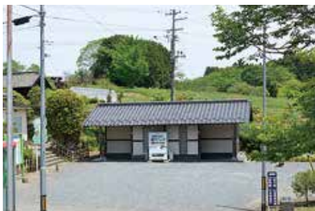
トイレ (管理事務所脇)

宮城県が南門地区西側と東門・大畑地区の東側に、多賀城市が政庁跡北側の管理事務所脇、多賀城廃寺跡東側に設置している。多賀城廃寺跡と東門地区のトイレは車イスで利用可能である。これらの清掃・維持・管理・修繕も多賀城市教育委員会によって日常的に実施されている。