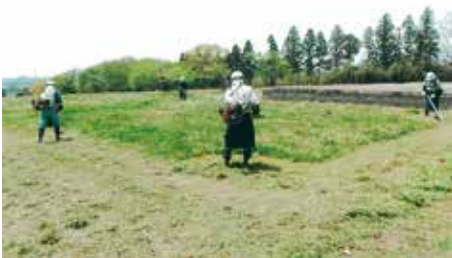
草刈り作業

この覚書に基づき、管理団体である多賀城市により、既整備地について史跡管理員による巡視やシルバー人材センターによる草刈り、応急的かつ小規模な修繕、トイレ清掃等の施設管理が実施されている。未整備地に関しては、地元団体による除草、NPO団体や地元町内会による花卉の植栽、山林等における樹木の剪定・伐採、マツクイムシの防除などの樹木管理、湿地環境を活用した多賀城跡あやめ園の運営などが実施されている。