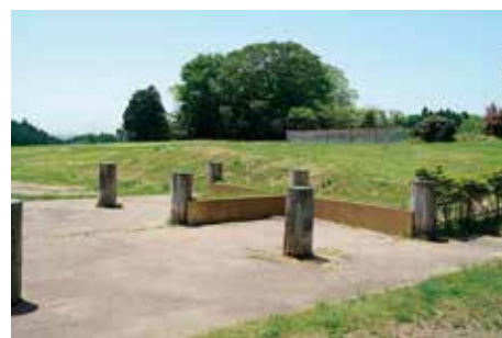
大畑地区 北門表示 柱の腐朽

当初に整備を実施した地区では、長い年月の経過により建物跡の表示等に劣化が生じているものも多い。特に六月坂地区でそれが目立つ。また、大畑地区の官衙北門にも柱の腐朽が見られる。