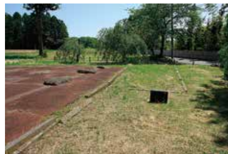
建物の 重複表示と その劣化 (六月坂地区)

地区ごとに表示時期が異なることは、相互の関連性の理解という面では問題があるが、丘陵単位で官衙が形成され、全体を見渡すことができない多賀城跡にあっては許容されうる方法と考えられる。