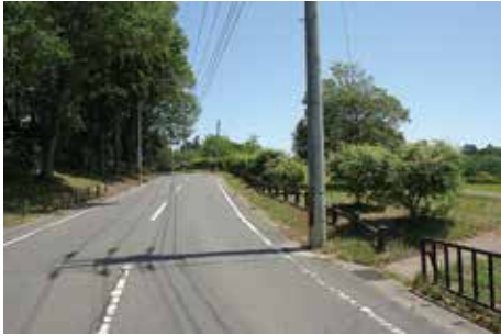
擬木柵 (東門 ・大畑地区)

地区、柏木遺跡等の整備区域と車道との境界には、金属製フェンスや擬木柵を設置してある。その他の公有化した土地においても、多賀城市が車道との境界に仮設柵を設置して車の進入止めと安全確保を図っている。