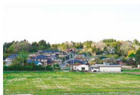
街道沿いの 市川集落

市川橋を渡り、市道市川線（旧塩竈街道）を東へ進むとすぐに「 そうしゃのみや 奏社宮道」の道標（大正13年建立）が見える。ここから北東方向に坂を登っていくと、右側には「 ふせいし 伏石」（弘安10年銘の けっしゅういたび 結衆板碑）・多賀城神社が、左側には きふね 貴船神社・多賀神社が点々と続いてある。これらは現在でも住民の信仰の対象となっており、信仰がもたらす景観とも言うべき雰囲気がある。道沿いの生垣や竹矢来は街道が持つ風致景観に調和しているが、一部にはコンクリートやブロック塀もある。