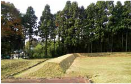
盛土整形による 築地堀跡の 立体表示 (政庁南辺)