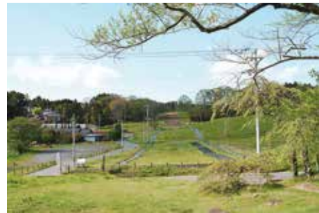
南門跡 から見た 政庁南面地区

西側には丘陵林地と鴻の池地区の湿地、中央部には政庁南大路とその両側の緑地、東には城前地区 じょうまえ の低丘陵、といった広い空間が広がっている。未整備の政庁南大路には、現在ミヤギノハギを植栽することにより路幅が示されている。この区域は今後の整備によって歴史的景観を向上させていくこととなるが、現状では、かつての宅地造成による段差や擁壁、電柱・電線などの景観阻害要因があり、また隣地にある民家・墓地も視界に入ってくる。