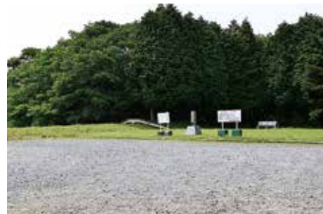
碎石敷広場 (北辺地区)

外郭北辺地区と作貫地区の園路沿いに、来訪者の見学の便宜を図るため、説明板や休憩施設と併設して広場を設けている。これらは管理運営用の機能も果たしている。