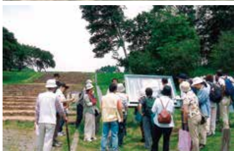
史跡案内 サークル