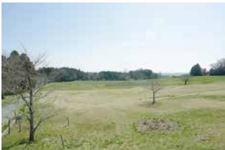
東門から 南側への眺望