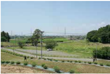
城前地区から 南西への眺望