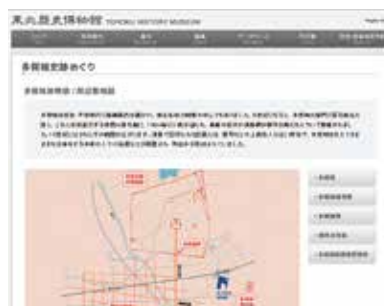
東北歴史博物館 「多賀城史跡めぐり」