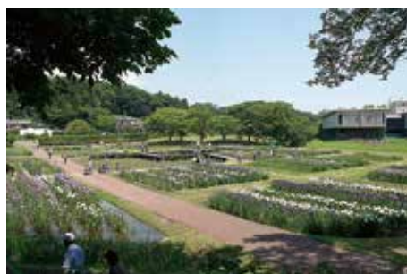
多賀城跡 あやめ園

外郭東南隅の湿地環境保全地区にあつて、湿性環境を維持することと、これを園地として活用することを目的に昭和61年に開始された。既に30年近くが経過し、今や市内の名所の一つとなっている。多賀城市が運営管理するもので、約500種300万本のハナショウブ・アヤメ・カキツバタが植えられ、常に水の管理がなされている。5月下旬から7月上