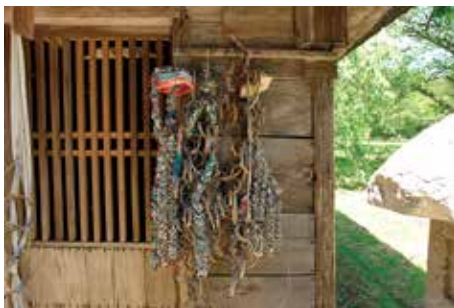
多賀神社 奉納された たが 籠