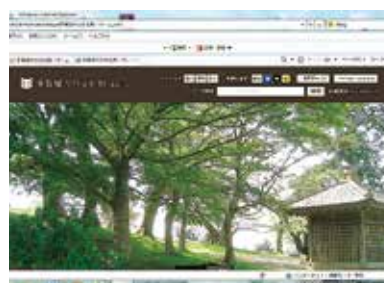
多賀城市教育委員会 「多賀城市の文化財」 (HPより)