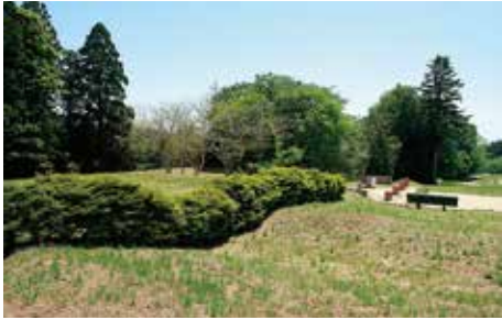
植樹による 築地堀跡の 立体表示 (東門跡北側)