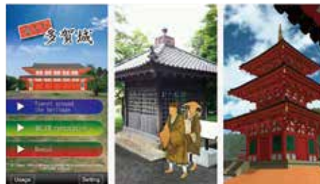
「歴なび 多賀城」 ホームページ (HPより)

平成26年度から、多賀城市教育委員会が市内の歴史遺産をスマートフォン等で案内するアプリケーション「歴なび多賀城」を提供している。これは歴史散策をする際に、GPSを活用して現地でAR画像や解説文が得られるように作られており、市内70ヶ所の歴史遺産を紹介する中で多賀城跡の多くの地区も対象となっている。特に政庁跡と多賀城廃寺跡では、建物跡の位置に行くと実際の風景に重なって原寸大で建物の復元CGを楽しむことができ、その映像とともに写真撮影もできるよう工夫されている。