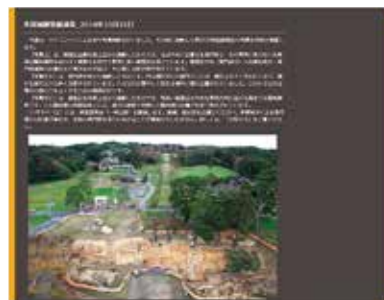
多賀城跡調査研究所 「多賀城スコープ」