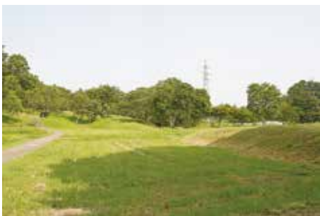
盛土養生した 築地塀跡 (南辺東側)

特別史跡内には、築地塀跡や礎石のように地上に表出した遺構が存在する。築地塀跡では、政庁跡や南辺東半部・東辺北部・北辺等、遺存状態が良好で高まりが地表に見られる区域で必要に応じて盛土・整形による保護が行われてきた。また、樹根による築地塀跡への影響が懸念される場所では、樹木の間