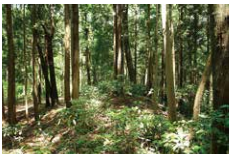
東辺北端部 築地塀跡の 現況

伐・除伐が実施された。しかし、間伐等が実施されていない範囲は広く、また伐採後の成長により再び影響が懸念される場所もある。