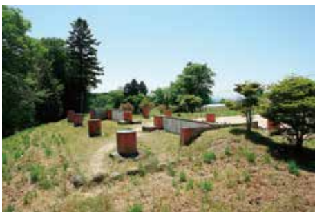
礎石建物の 表示 (II期東門)