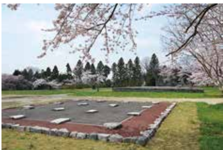
礎石建物の 表示 (政庁東楼)

すべてを平面表示あるいは立体的な表示としてきた。柱、建物範囲の舗装、軒廻りの表現等を試行してきたため、地区ごとに表現手法が多少異なっている。今後表現手法の研究を続け、新たな地区の整備を行う場合や既整備地区の再整備を行う際に、より良い方法を導入していく必要がある。